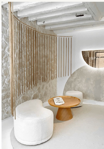
SPATIUM PARIS III