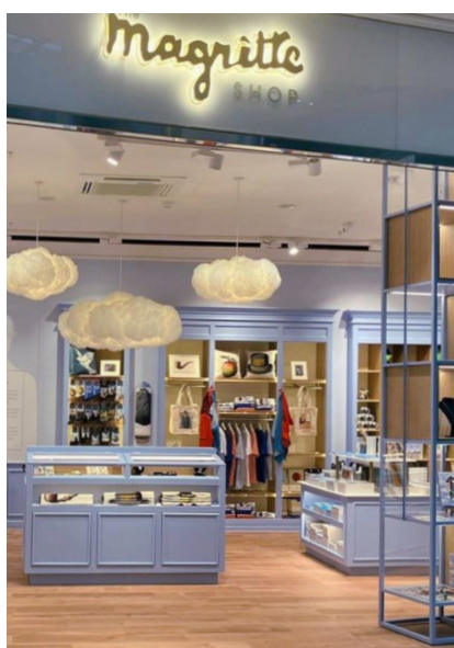
MAGRITTE SHOP BRUXELLES