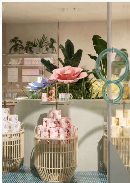
BOUTIQUE DE THÉS FLORAUX