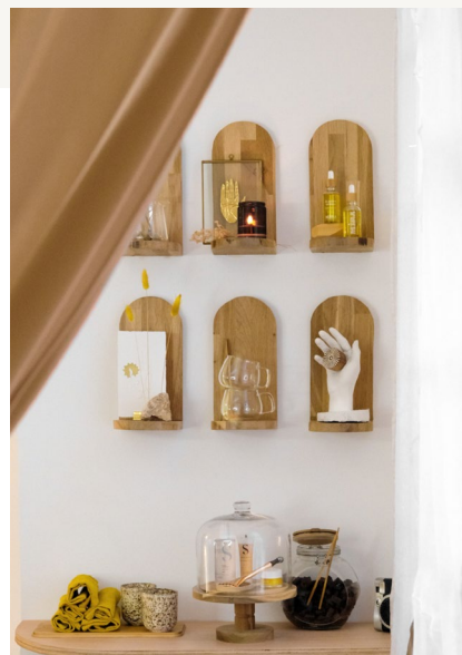
SPATIUM PARIS IV